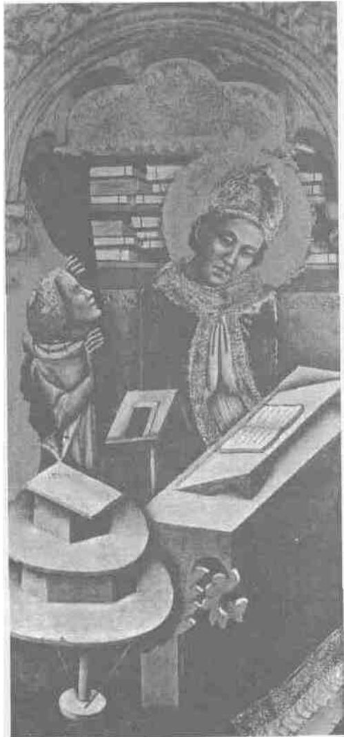
Tavola di Jacopo de' Bavosi (secolo XIV) in Pinacoteca di Bologna. Il diacono Pietro, ntraendo la cortina, rivela la biblioteca e l'ispirazione divina di Gregorio, espressa dall'orecchio del Papa teso all'ascolto.

"La spada a due tagli [spatem], poi che il diletto figlio nostro Gregorio - allora costì difensore - aveva lasciato presso il predecessore, mandatemela mediante Secondo, monaco, e Castore, fratelli della presente" (41).